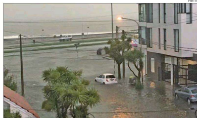
INUNDADA. Así estuvo la ciudad balnearia ayer a la tarde.

AGENCIAS El inicio del fin de semana largo se vio opacado por las fuertes tormentas y granizo que afectaron ayer a gran parte de la costa bonaerense, en especial Mar del Plata, donde muchos sectores de la ciudad quedaron anegados, y donde se registraron importantes destrozos por las piedras y el viento.