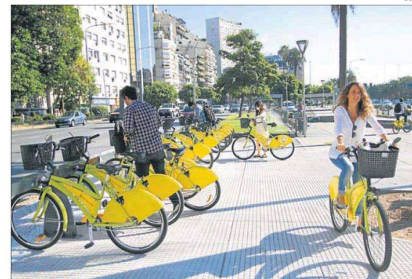
CONCESION. Se votó el jueves en la Legislatura de la Ciudad.

tiene 200 estaciones y 2.500 bicis. Quien obtenga la concesión deberá duplicar ambas cifras.